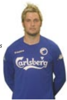
Jesper Christiansen igen i Danmarks trup og nu det naturlige andenvvalg i målet for Morten Olsen.