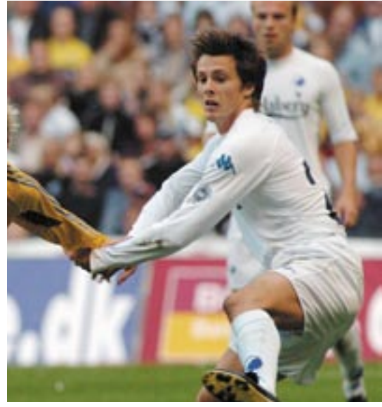
Han skal væk? Nej, ikke vores Bech!

Ja, jeg synes det er et meget spændende spil. Jeg har spillet gennem en længere årrække og bruger mere og mere tid på det. Jeg