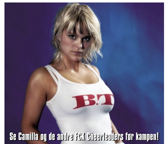
Se Camilla og de andre FCK Cheerleaders før kampen!

Skive, som vi mødte skærtorsdag i Dong Cup'en var vores danske modstander nummer 30. Udover de elleve andre SAS Liga klubber er der tolv tidligere superligaklubber. De sidste seks modstandere har vi kun mødt i pokalturneringen, og de har to ting til fælles: De har haft hjemmebanefordel, og de har tabt.