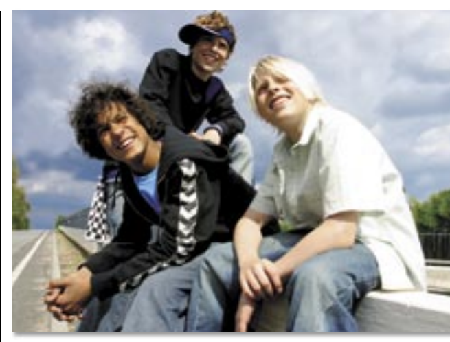
B-BOYS optræder på Familietribeunen til dagens kamp mod FC Midtjylland