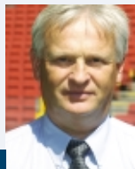
Cheftræner Hans Backe

De har fået en udmærket start på sæsonen og vil sikkert spille med om guldet i sidste ende. Jeg ser det som en åben kamp, men jeg håber selvfølgelig at vi vil være i stand til, via vores system samt kreativitet og improvisation, at sejre i PARKEN.