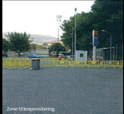
Zone til kropsvisitering.