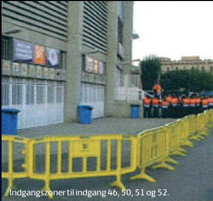
Indgangszoner til indgang 46, 50, 51 og 52.