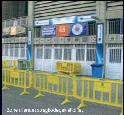
Zone til andet stregkodedtek af billet.