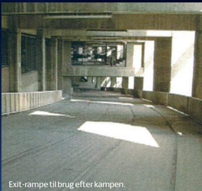
Exit-rampe til brug efter kampen.