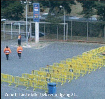
Zone til første billettek ved indgang 21.