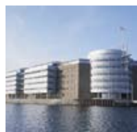
Man B&W Diesel A/S