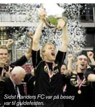
Sidst Randers FC var på besøg var til guldefesten.