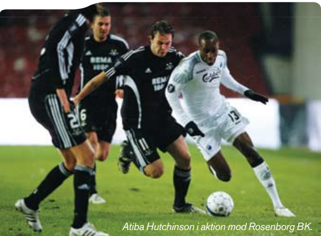
Atiba Hutchinson i aktion mod Rosenborg BK.