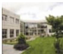
Chr. Hansen A/S