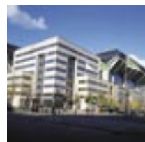
Parken Sports & Entertainment A/S