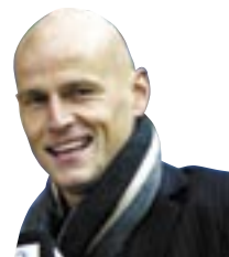
Cheftrener: Ståle Solbakken

kampe vi spiller lige her i denne periode af efteråret. Mange af vores spillere spiller både SAS Liga, UEFA Champions League, pokalkampe og landskampe, og vores trup er p.t. lidt smal, men vi har trods alt tabt meget få kampe, og det er jeg selvfølgelig tilfreds med.