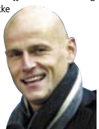
Cheftræner: Ståle Solbakken

Jeg forventer at vi bibeholder den gode hjemmebanestatistik vi har og dermed får tre point. Der sker ved at vi spiller vores eget spil. Det har sådan set ingen indvirkning, hvad resultatet bliver mod FC Midtjylland Skærtorsdag. Uanset hvad skal vi fastholde vores koncept og ikke skele til modstanderne eller resultater. Denne kamp kommer til at foregå på vores hjemmebane og her skal vi bestemme.